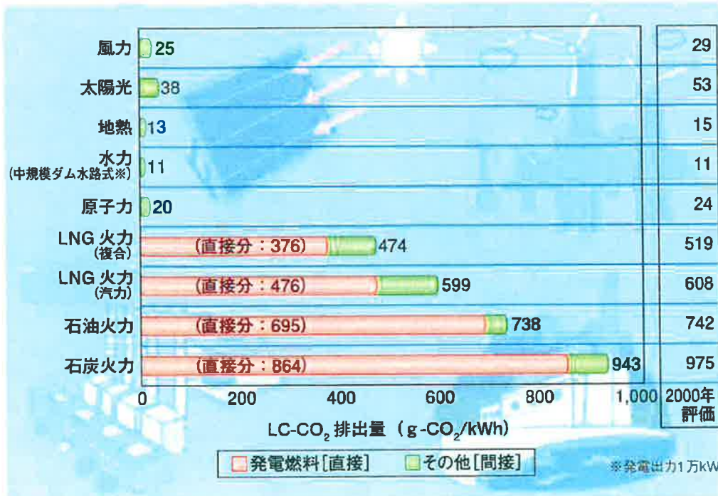
電源別の LC-CO 2 排出量

わが国の CO 2 排出量は約 12.14 億トン（平成 20 年実績）で、そのうち、発電に伴い排出される CO 2 量は、全体の約 30% の 3.87 億トン（平成 20 年度事業用発電）です。電気事業では、CO 2 排出原単位 (kg-CO 2 /kWh) の 1990 年度比 20% 削減を目標として、火力発電における発電効率の向上、発電燃料の石油から天然ガスへの移行、原子力発電による発電電力量の一定割合の確保、再生可能エネルギーの利用など、さまざまな検討・実践を進めています。この際、電源別の CO 2 排出量やその削減の程度を正確に測定する上で有益な指標が、電源別のライフサイクル CO 2 排出量（LC-CO 2 排出量）です。