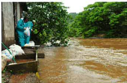
はんらん寸前の熊木川で、住宅の前に土嚢を積む市の職員ら=8日午前10時44分、七尾市中島町上町

8日午前中に県内に最接近した台風9号は、志賀町では24時間の雨量が観測史上最高になる降雨をもたらした。七尾市でも熊木川が一時、はんらん危険水位を超えた。金沢地方気象台によると、初上陸地が北陸地