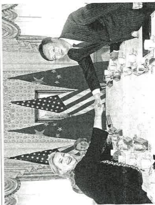
26日、ニューヨークで握手を交わすクリントン米副大統領(左)と中国の楊潔麟外相(右)。共同

民主党政策調査会がまとめた東日本大震災の復興財源を賄う臨時増税案が27日、明らかになった。臨時増税の期間としては重なる復興債の償還期間について「国民負担、経済状況に十分に配慮し、政府が検討している10年間より長い期間を積極的に検討すべき」と明記。政府から兆単位程度を確保したとしている歳出削減と税外収入は「兆単位で積み増しを求めるとした。復興増税の柱となる所得税の増税期間について、民主党税制調査会(藤井裕久会長)は復興債の償還に合わせ、2013年1月か